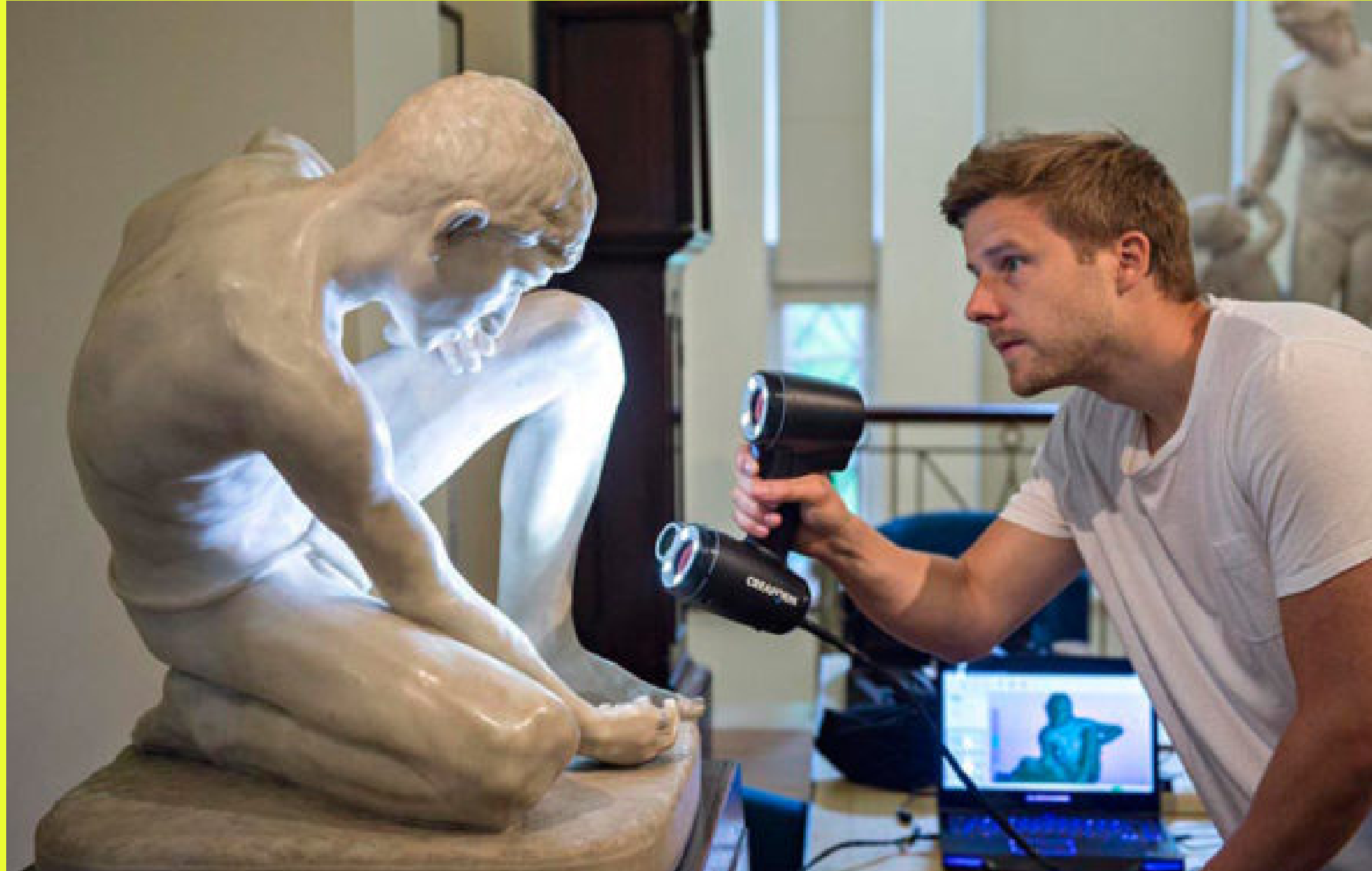
Oliver Laric (1981, Innsbruck, Áustria) vive e trabalha em Berlim.